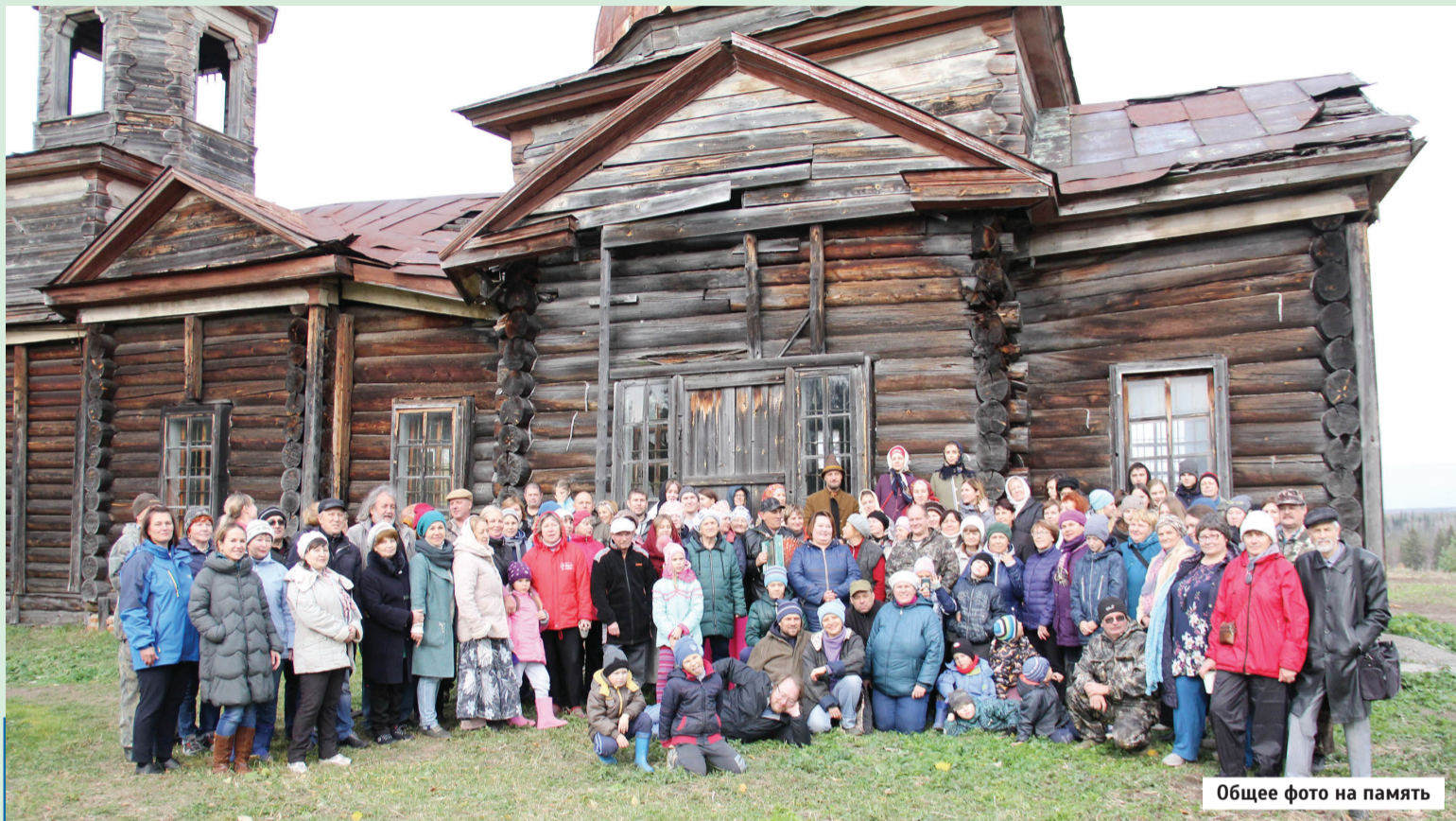
Общее фото на память

А как известно, деревня всегда была сильна традициями, сохранением семейных ценностей, почитанием старших, стремлением к правде и справедливости. Деревня – это и по сегодняшний день прочнейший фундамент России!